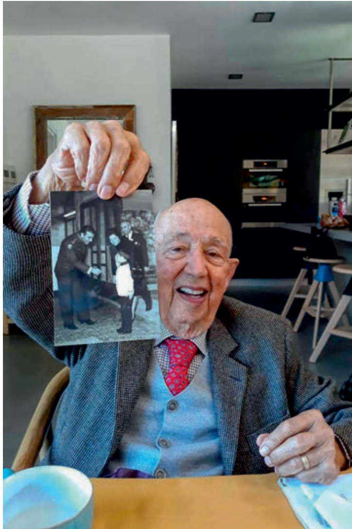
Babam | My Father

Ersin Tatar - Objektifinden Kuzey Kıbrıs Türk Cumhuriyeti | Turkish Republic of North Cyprus From My Objective