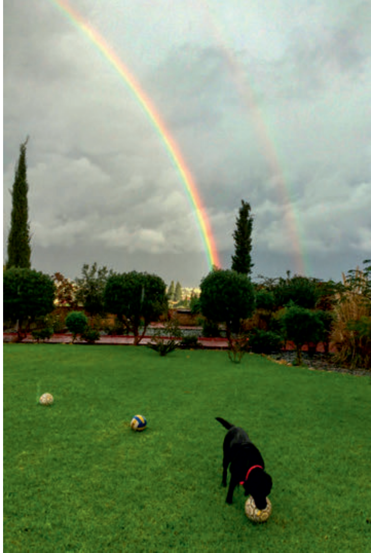
Gökkuşığı | Rainbow

Ersin Tatar - Objektifinden Kuzey Kıbrıs Türk Cumhuriyeti | Turkish Republic of North Cyprus From My Objective