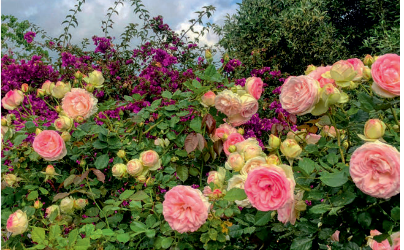
Gül Bahçesi | Rose Garden

Ersin Tatar - Objektifinden Kuzey Kıbrıs Türk Cumhuriyeti | Turkish Republic of North Cyprus From My Objective