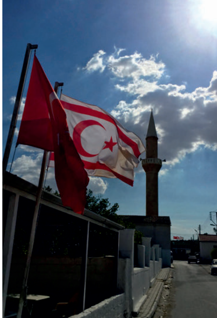
Bayrak 2 | Flag 2

Ersin Tatar - Objektifinden Kuzey Kıbrıs Türk Cumhuriyeti | Turkish Republic of North Cyprus From My Objective