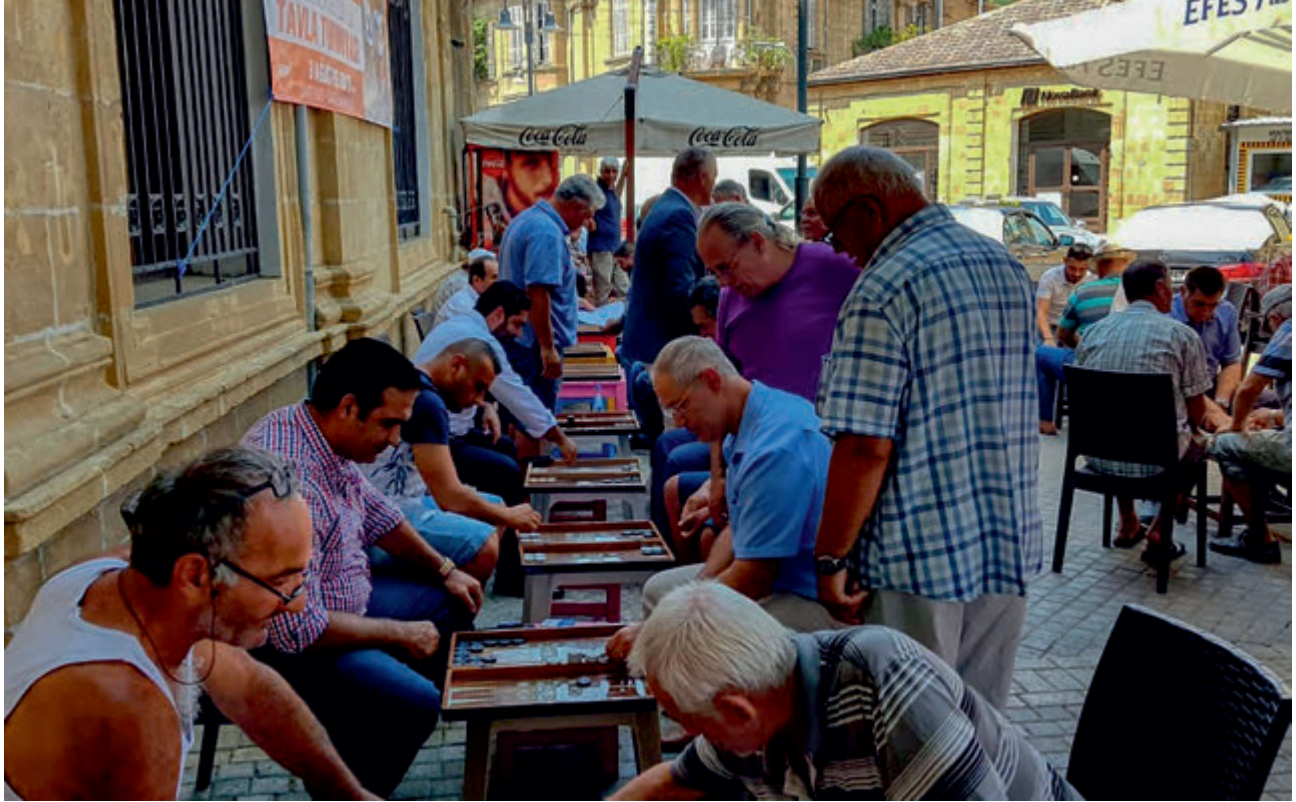
Tavla | Backgammon