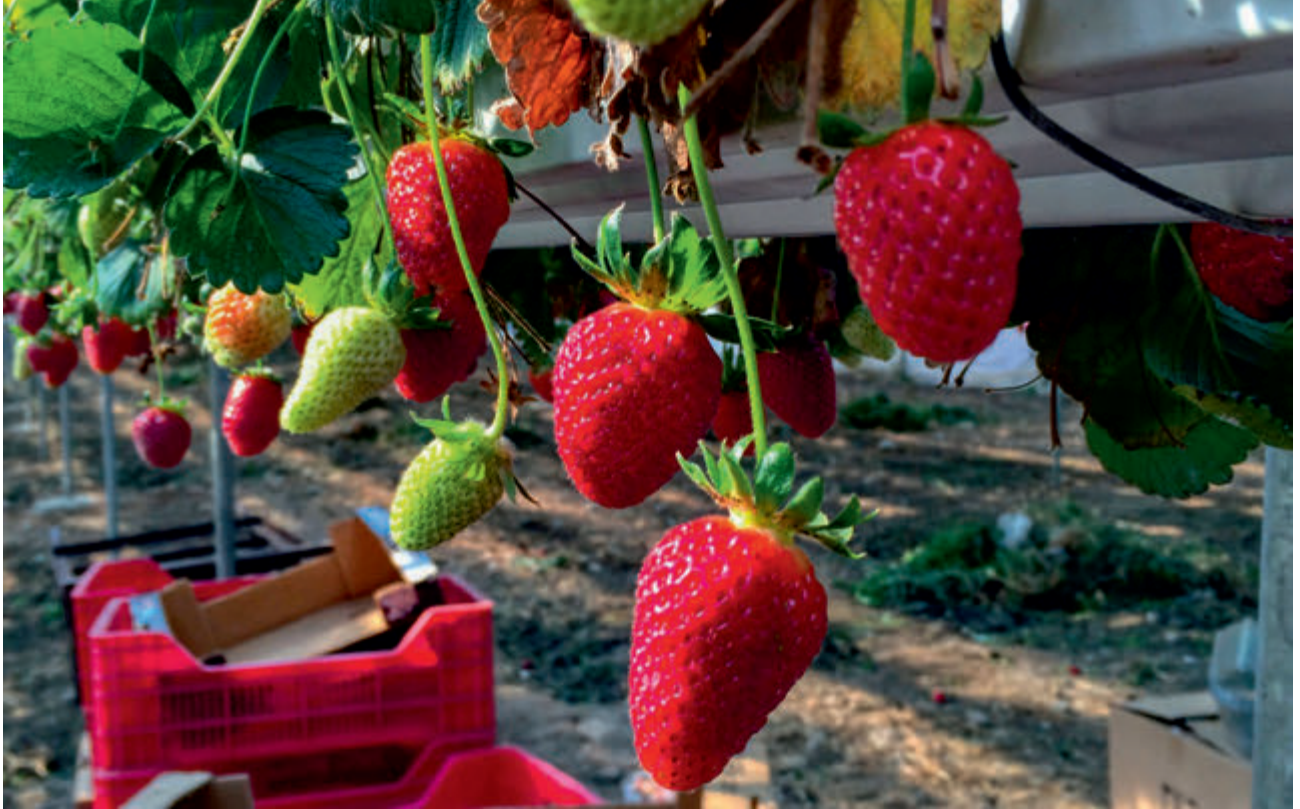
Çilek | Strawberry