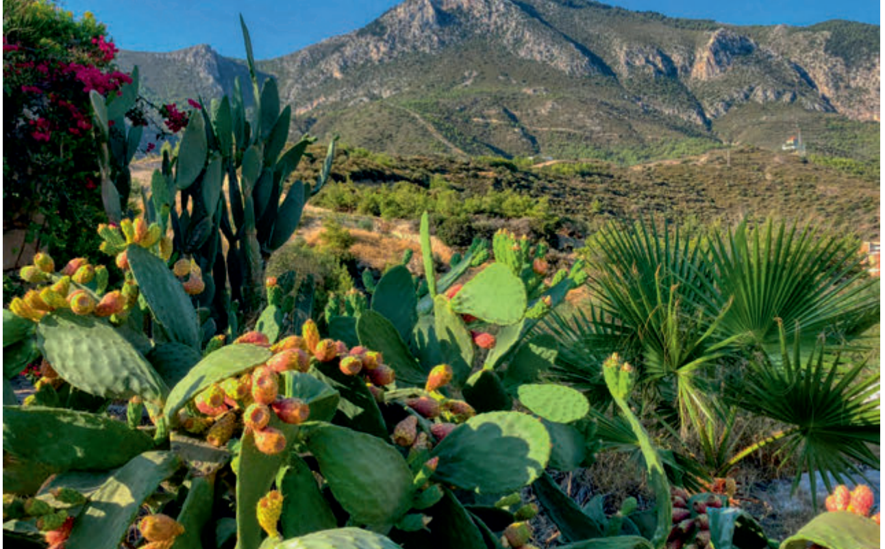
Babutsa | Prickly Pear

Ersin Tatar - Objektifinden Kuzey Kıbrıs Türk Cumhuriyeti | Turkish Republic of North Cyprus From My Objective