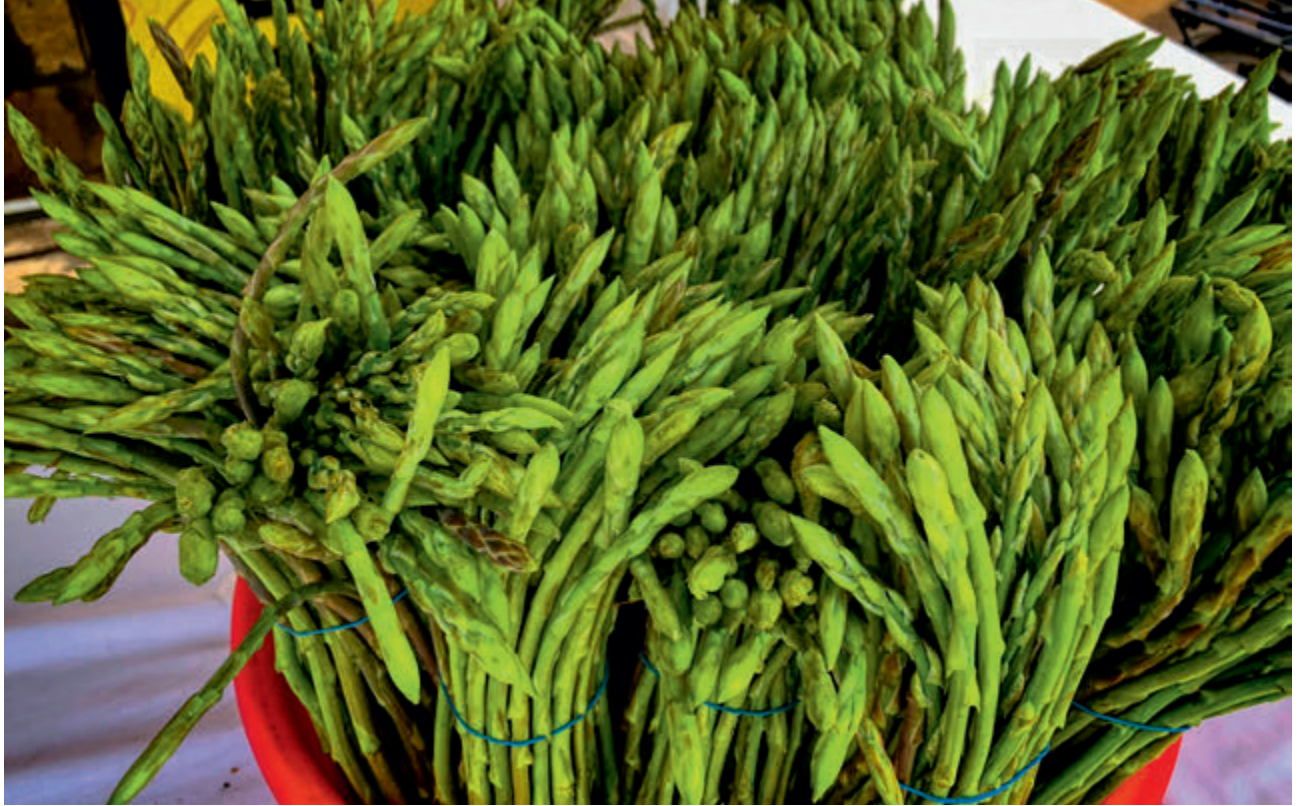
Ayrelli | Asparagus