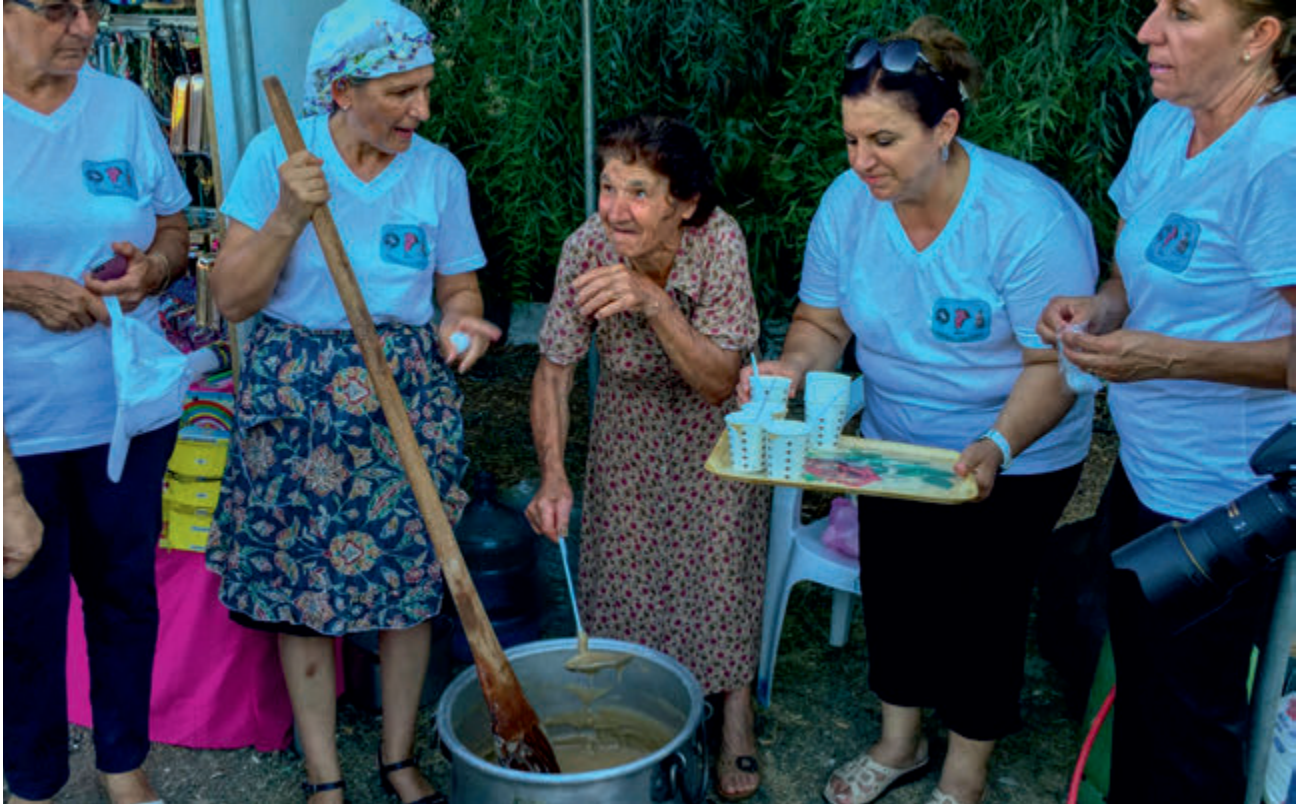
Palüze | Blancmange