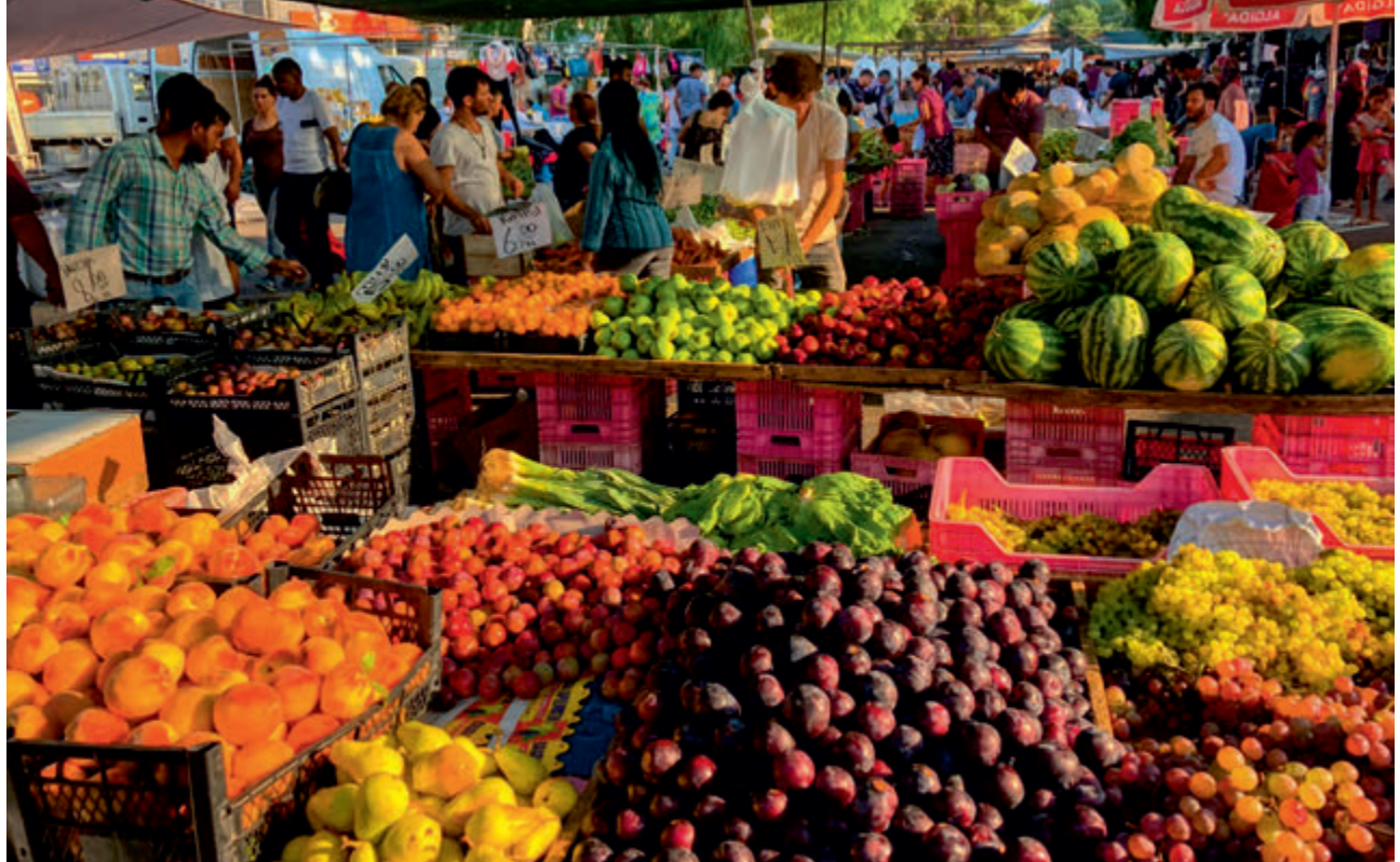
Pazar | Bazaar