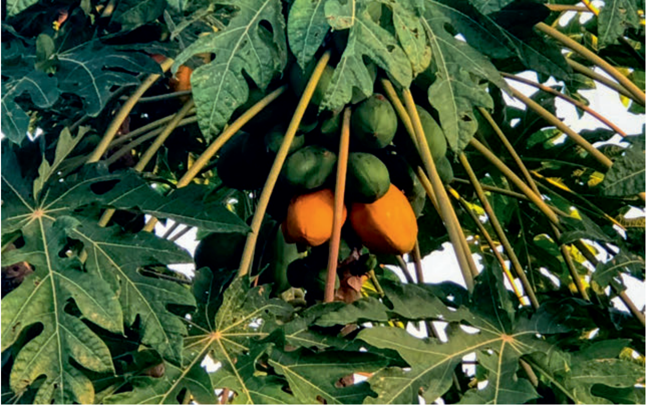
Papaya | Papaya

Ersin Tatar - Objektifinden Kuzey Kıbrıs Türk Cumhuriyeti | Turkish Republic of North Cyprus From My Objective