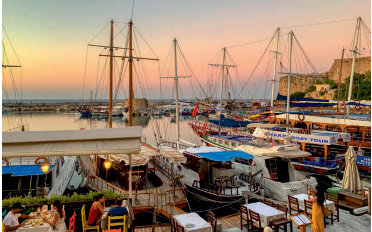
Girne Limanı | Kyrenia Old Harbour