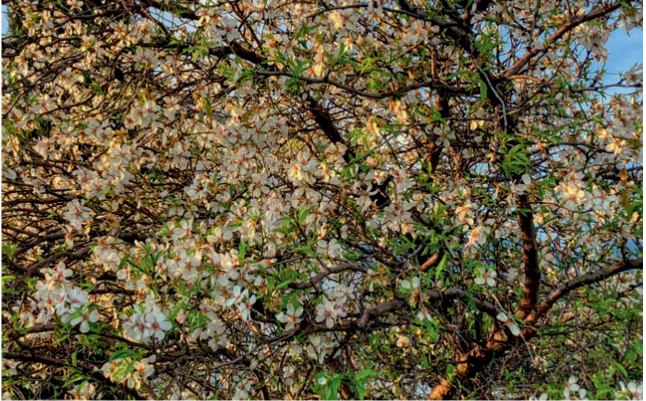
Badem Çiçeđi | Almond Bloom

Ersin Tatar - Objektifinden Kuzey Kıbrıs Türk Cumhuriyeti | Turkish Republic of North Cyprus From My Objective