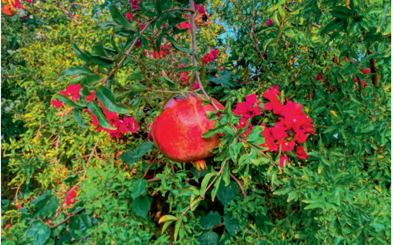
Nar | Pomegranate

Ersin Tatar - Objektifinden Kuzey Kıbrıs Türk Cumhuriyeti | Turkish Republic of North Cyprus From My Objective