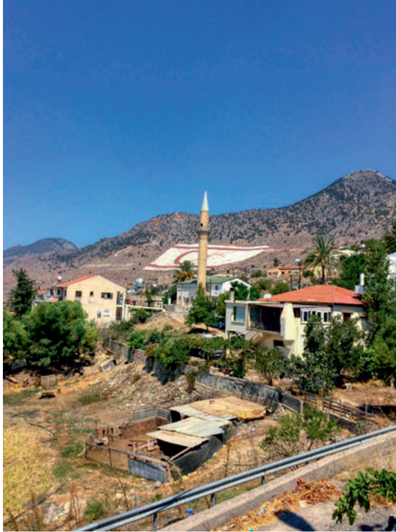
Bayrak 1 | Flag 1

Ersin Tatar - Objektifinden Kuzey Kıbrıs Türk Cumhuriyeti | Turkish Republic of North Cyprus From My Objective